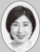
江東区長 木村 弥生