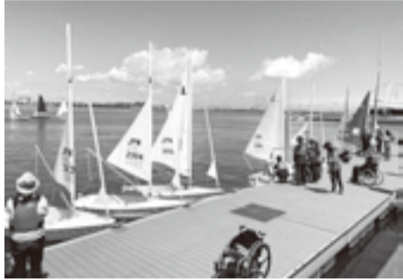
▲爽やかな潮風を満喫できます

区内在住・在勤・在学の中学生以上の方5人(抽選) 区内在住・在勤・在学で障害者手帳をお持ちの中学生以上の方5人(抽選) ※未成年の方は保護者の承諾と同伴が必要です。 費 500円