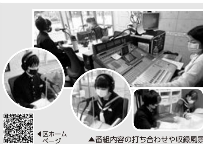
▲番組内容の打ち合わせや収録風景

中学生放送研究会・小学生放送クラブ ラジオ番組を自分たちで制作し、FMラジオ局で放送する「中学生放送研究会」と「小学生放送クラブ」の参加者を募集します。