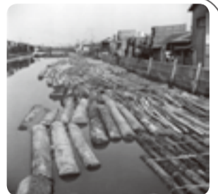
▲昭和30年頃の平久川(木場3)

※DX(デジタルトランスフォーメーション)：情報通信技術の活用により、人々の生活をあらゆる面でより良い方向に変化させること