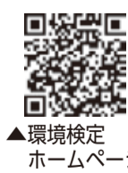
環境検定ホームページ

区では、2050年までに温室効果ガス(主に二酸化炭素)の排出量を実質ゼロにする「ゼロカーボンシティ江東区」を目指しています。脱炭素社会の実現に向けた行動を加速していくため、昨年度から、区民の方々の環境への意識向上を目的とした「江東区環境検定」を実施しています。今年度の受検期間は9月中です。問題レベルは中学生以上の方を対象としています。