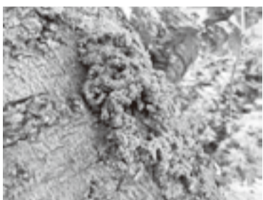
▲幼虫が排出するフラス

「こんなサインに注意」 幼虫は木の中にいる間、「フラス」という木くずとフンが混ざったかきんとう状のものを排出します。木の根元や幹にフラスが出ていると、内部に幼虫がいる可能性があります。 環境保全課調査係 ☎(3647)6148 FAX(5617)5737