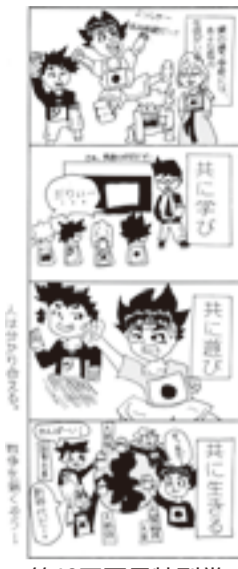
▲第18回区長特別賞・コマ漫画の部 ジュニア大賞作品「新時代だ!」 ▲第18回イラストの部 ジュニア大賞「冬」