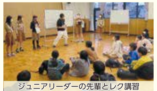
ジュニアリーダーの先輩とレク講習

時 内 下表のとおり 区 区内在住・在学の小学5年生~中学1年生まで 費 6,000円(教材費、宿泊研修参加費等) [申込用紙配布場所] 区ホームページ、区立小・中学校、青少年課地域連携係(区役所4階24番) 締 8/18(金) 申 区ホームページ、または申込用紙に必要事項を記入し、〒135-8383区役所青少年課地域連携係へ郵送・窓口で☎3647-9629、FAX3647-8474