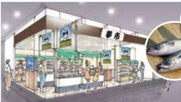
▲三陸常磐 夢市の店舗イメージ