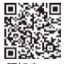
▲認知症ガイドブック

「申し込み」令和5年4月1日現在70歳の方 「お問い合わせ先」HPホームページ 「Eメール」 ☎(3647)4398 FAX(3647)3165