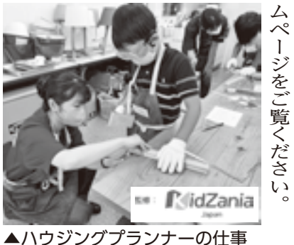
▲ハウジングプランナーの仕事