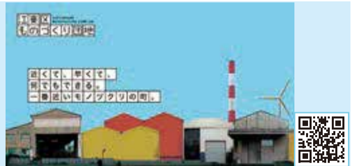
▲専用WEBサイト「江東区ものづくり団地」

区と連携して、江東区のものづくりの「素晴らしさ」を広めませんか。区では次のような支援を行います。 ○展示会など、製品や技術をPRできる場の提供 ○認定企業を軸とした交流会の開催 ○認定企業PR冊子の発行・配布 ○専用WEBサイト「江東区ものづくり団地」への掲載(HP https://kotobrand.jp/ ) ○江東ブランド認定ロゴマークの付与