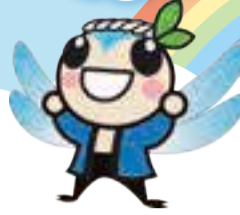
えこっくる江東 キャラクター たすけくん