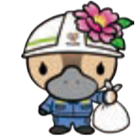
江東区観光キャラクター コトミちゃん

6/3(土)を臨時休館。環境フェア開催準備のため。また6/4(日)の環境フェア当日は展示室を見学できません。