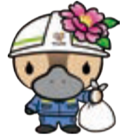
江東区観光キャラクター コトミちゃん

6/3(土)を臨時休館。環境フェア開催準備のため。また6/4(日)の環境フェア当日は展示室を見学できません。