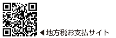
地方税お支払サイト

令和5年度の軽自動車税(種別割)の納期限は5/31(水)です。納付方法の詳細は、納税通知書に同封のチラシまたは区ホームページをご覧ください。また、令和5年4月から軽自動車税(種別割)について、納付書に印字されている二次元コード(eL-QR)やeL番号を利用したお支払いが可能になりました。詳細は地方税共同機構が運営する「地方税お支払サイト」(下記二次元コード)をご覧ください [締] 納税課収納推進係 ☎3647-2063、FAX3647-8646