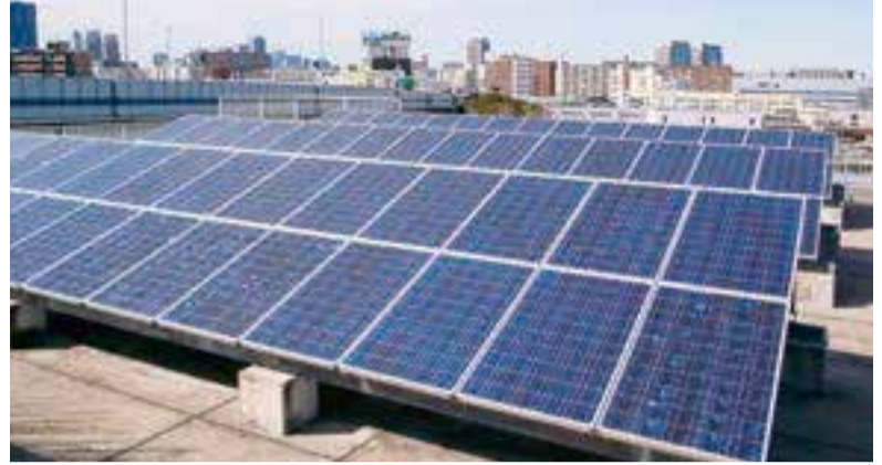
▲太陽光発電システムの設置イメージ