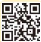
▲こうとう若者・女性しごとセンターホームページ