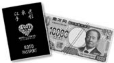
▲「(仮称)KOTOパスポート」と 新一万円札(イメージ)