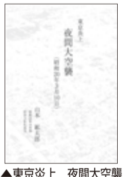
▲東京炎上 夜間大空襲

区立幼稚園では、令和5年4月から入園を希望する園児について、随時追加受付を行っています。申込方法は、入園を希望する各園に直接お問い合わせください。 ※3年保育は南陽幼稚園・豊洲幼稚園・なでしこ幼稚園のみ。 「入園資格」 次の年齢で、区内に住所を有する方(令和5年3月31日(金)) 「4歳児(2年保育)」 平成30年4月2日〜平成31年4月1日までに生まれた方 「3歳児(3年保育)」 平成31年4月2日〜令和2年4月1日までに生まれた方 各幼稚園または学務課幼稚園係 ☎(3647)9703 FAX(3647)9053