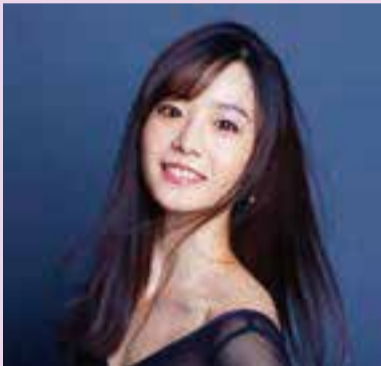
▲池田理沙子さん