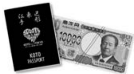
▲「(仮称)KOTOパスポート」と 新一万円札(イメージ)