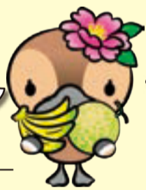
江東区観光キャラクター コトミちゃん