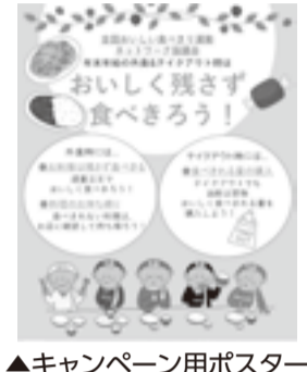
▲キャンペーン用ポスター

区では、全国おいしい食べ り運動ネットワーク協議会と連 携し、「おいしく残さず食べ きろう!」をキャッチフレーズに 外食時等の食べきり運動を推進 する啓発キャンペーンを12月 1月まで実施します。