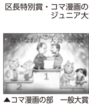
▲コマ漫画の部 一般大賞