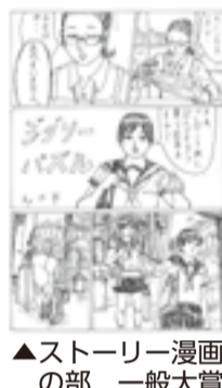
▲ストーリー漫画の部 一般大賞

※いずれも 場 森下文化センター(森 下3-12-17) ☎(5600)8666 FAX(5600)8677