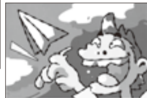
▲イラストの部 ジュニアA大賞