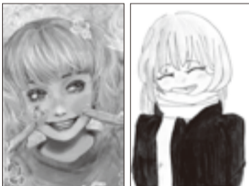
▲イラストの部 ジュニアB大賞