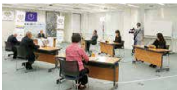
▲今のまちの魅力や課題についても多くの意見ができました

11月11日、「区長と話そう!こうと〜く」が行われました。今回は、「地下鉄8号線の延伸と今後の沿線まちづくり」をテーマに、沿線まちづくり構想の策定に向けたワークショップに参加された方々をお招きし、区長と意見を交わしました。 皆さんからは、ワークショップに参加した感想や、地下鉄8号線の延伸をどのように地域活性化につなげていくかなどアイデアや意気込み等をお話しいただきました。 参加者からは、「今のまちの良い部分は無くさずに、新しくアップデートされると良い」地域の歴史や文化をアピールしな