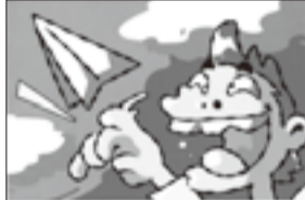
▲イラストの部 一般大賞

※いずれも 場 森下文化センター(森 下3-12-17) ☎(5600)8666 FAX(5600)8677