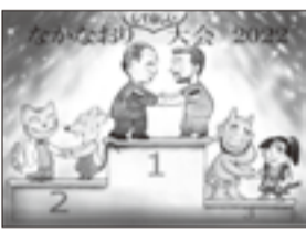
▲コマ漫画の部 一般大賞