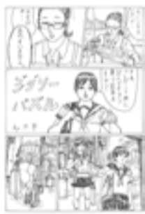
▲ストーリー漫画 の部 一般大賞