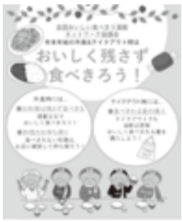
▲キャンペーン用ポスター

年末年始で会食の機会が多 くなり、ホームパーティーで テイクアウトが増える時期で す。食べきれない量の注文を 心がけ、おいしく残さず食べ きりま