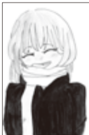
▲イラストの部 ジュニアA大賞