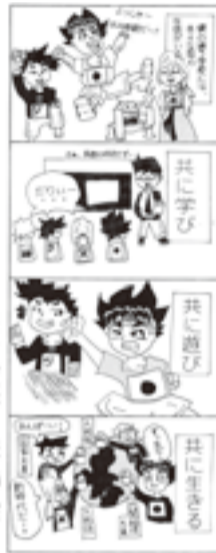
区長特別賞・コマ漫画の部 ジュニア大賞