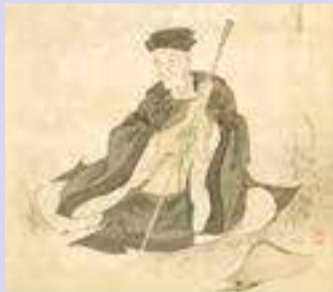
▲松尾芭蕉(上村白鷗画・溪斎賛 芭蕉坐像図)