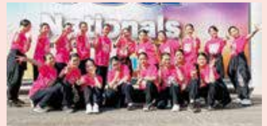
▲再び全国の舞台へ

3月に行われたダンスの全国大会において、HIPHOPチームとして出場したオープン部門で見事優勝。JAZZ部門にも出場を果たしました。メンバー同士が支えあい、オープン部門では「全力で踊っている瞬間を楽しみ、誰1人悔いが残らない演技」、JAZZ部門では「全員が笑顔でのパフォーマンス」ができたそうです。今後の抱負について「もっとレベルアップして素敵な演技を披露できるようにがんばります」と力強く答えてくれました。