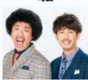
トータルテンボス