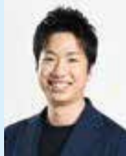
水谷隼さん (卓球・東京2020オリ ピック金メダリスト)