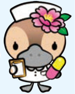
▲江東区観光キャラクター コトミちゃん