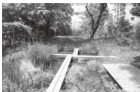
▲横十間川親水公園ポケットエコスペース

縮 10月5日(水) 申 9月26日(月)から区ホームページまたは電話で施設保全課庶務係へ ☎ (3642)5099 FAX (3642)4748