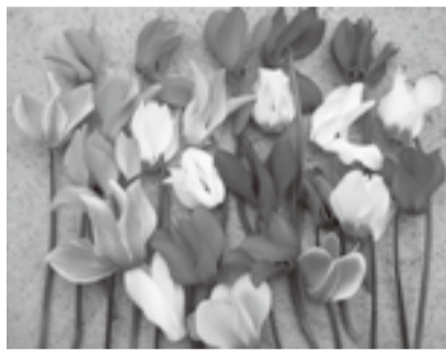
▲シクラメンを栽培してみませんか

ガーデニングを通じたコミュニケーションづくりを進める講座です。プランダでお花を育て、生活に取り入れる楽しみを学びながら、地域の人の交流を深めます。花と緑いっぱいのもちづくりに参加してみませんか。 時 10月20日(木)、11月4日(金)・17日(木) 午後2時～4時(全3回) 場 江東区文化センター(東陽4-11-3) 内 区内在住、在勤で16歳以上の方25人(抽選。抽選結果は、はがきまたはメールで連絡。重複申込無効)※今年度および昨年度本講座(シリーズを問わず)