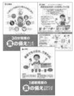
▲3種類の食の備蓄パンフレット