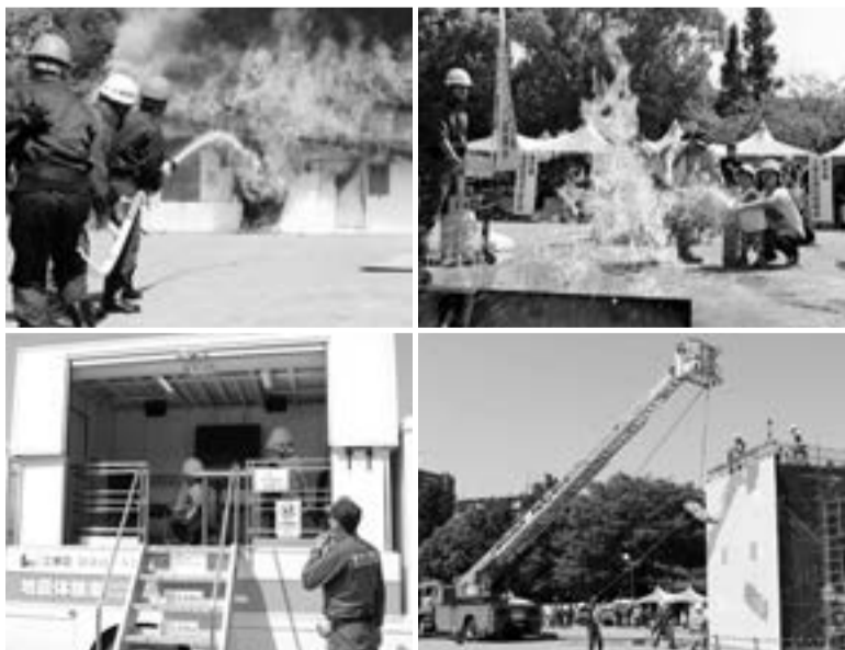
▲前回の木場公園での防災訓練の様子

区では首都直下地震を想定した防災訓練を実施します。区と防災関係機関が連携して災害に対処するための訓練を木場公園で行うほか、3か所の小・中学校を会場に、自助・共助の防災行動力を高めるための地域訓練を実施します 時 場 下表のとおり 問 防災課防災担当 ☎ 3647-9588、FAX3647-8440