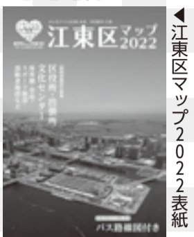
江東区マップ2022表紙

[配布場所] こうとう情報ステーション(区役所2階)、区民課(区役所2階)、豊洲特別出張所・各出張所 費 無料 申 広報広聴課広報係 ☎3647-2299、FAX5634-7538