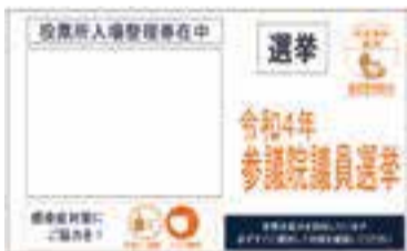
「投票所入場整理券」封筒