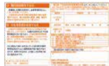
ご自身の「投票所入場整理券」裏面

誤って、ご家族の入場整理券をお持ちにならないようご注意ください。 ← なお、この地図は、7月10日(日)投票日当日にお越しになる場合の投票所です。