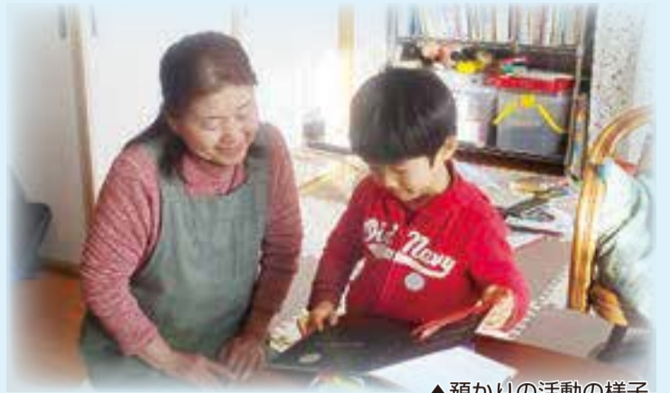
▲預かりの活動の様子

☎ 社会福祉協議会ファミリー・サポート・センター(東陽6-2-17(高齢者総合福祉センター2階)) ☎5683-1573、FAX5683-1570(8:30～17:00(平日のみ))