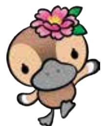
▲江東区観光キャラクター コトミちゃん