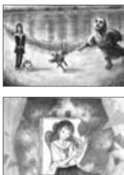
イラストの部 ジュニアB大賞