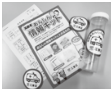
▲あんしん情報キット

区では、ひとり暮らしの高齢者や高齢者のみで暮らしが不安な方が安心して暮らせるよう、安否確認や孤独感の緩和、緊急時の備え等を目的とした見守り事業を実施しています。事業内容・対象となる方は左表のとおりです。ぜひご利用ください。 また、今年9月に対象の方に郵送した、「ひとり暮らし等高齢者世帯調査」の未回答者向けに、令和4年1月下旬から順次、区の各種相談窓口のご案内等をお送りします。こちらもご利用ください。