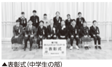
▲表彰式(中学生の部)