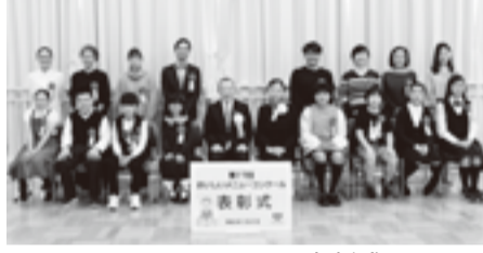
▲表彰式(ファミリーの部)