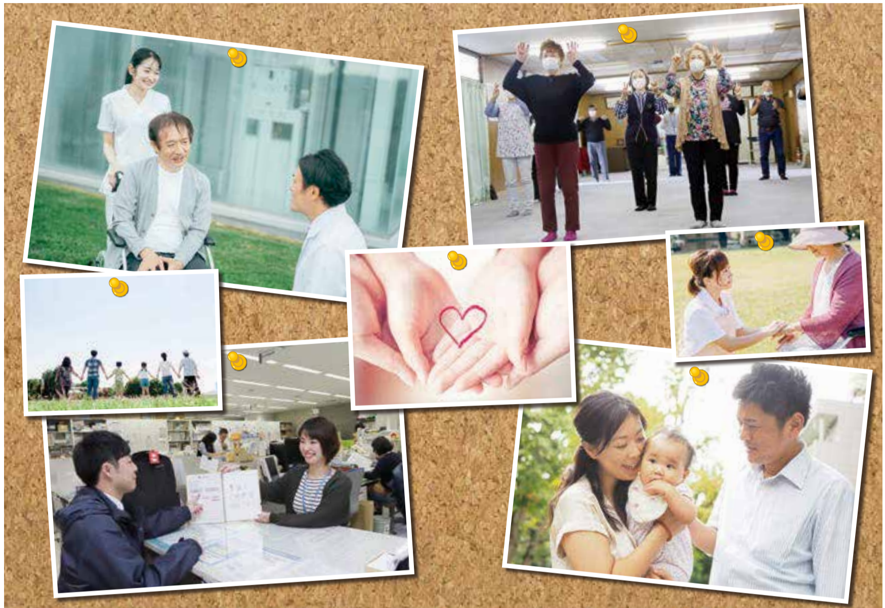
▲誰もが、住み慣れた地域で安心して暮らすことができる社会を目指して