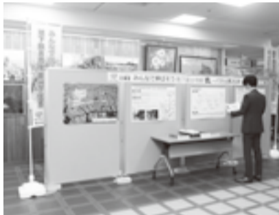
▲昨年行ったパネル展の様子

※開庁時間内にご覧ください。ただし、各会場の初日は10:00から、最終日は16:00まで