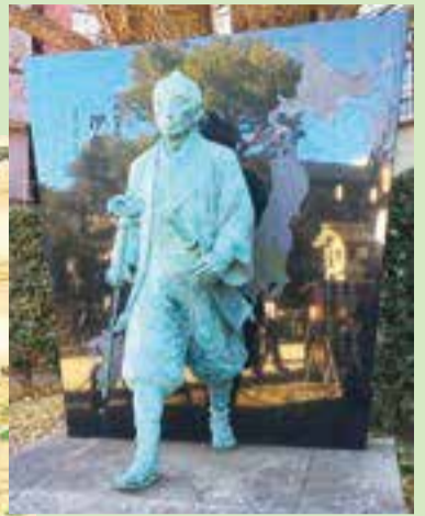
▲富岡八幡宮境内にある伊能忠敬像