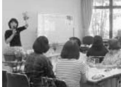
▲一昨年の講座の様子

締 4月14日(水) 申 往復はがきに①講座名②氏名とふりがな③年齢④住所⑤電話番号を記入し、〒135-8383 区役所管理課CIG推進係へ※ホームページからも申込できます 時 (3647) 2079 費 3,500円(材料費) 内 野菜の基礎知識、ベランダガーデニングならではの夏野菜の栽培方法、楽しみ方など ※講座では野菜の種まきや植付けセットをお持ち帰りいただきます。