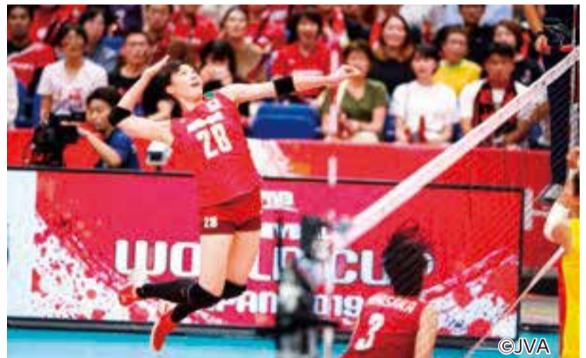
▲迫力のある試合を目前で!

女子日本代表チームによる国際親善試合に、区民を無料招待します。東京2020オリンピックのバレーボール会場で、迫力ある試合が観戦できます 時 5/1(土) 場 有明アリーナ(有明1-11-1) 入 区内在住・在学・在勤の小学生以上の方10組20人(抽選) ※小学生は保護者同伴 費 無料 締 4/11(日)16:00 申 登録フォーム(HP https://forms.gle/CaS41WvPt7SWHkzh6 ) から 問 日本バレーボール協会 e volleyballtickets@jva.or.jp HP https://www.jva.or.jp/index.php/international/2021/tokyochallenge_women/outline