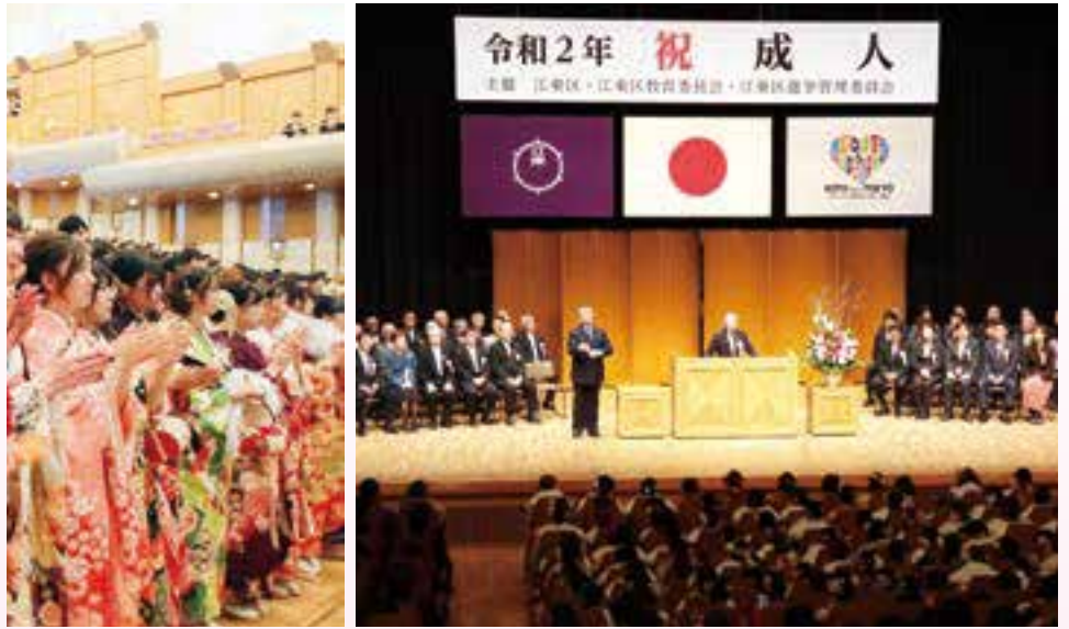
▲過去に行われた成人式の様子