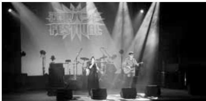
◀前年度、本選の様子

審査員 江東アマチュアバンド活動推進委員会、音楽ディレクターほか 締 10月17日(日)必着 申 江東区文化コミュニティ財団各施設にある申込書(ホームページからもダウンロード可)と演奏・バンドメンバーがわかる本選と同様の演奏動画(Youtubeまたは動画データ等 ※本選と同じバンド編成・アレンジにすること)・メンバー写真、〒135-0016東陽4-11-3江東区文化センターへ郵送、メールまたは窓口で 費 1団体500円※本選出場が決定した団体は本選チケット20枚を購入