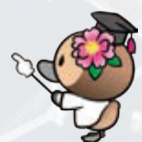
▲江東区観光キャラクター コトミちゃん

A2. 江東区の調査では、東京メトロ東西線との結節駅である東陽町のほか、駅徒歩10分圏外となっている鉄道交通不便地域解消のため、豊洲~東陽町間、東陽町~住吉間の概ね中間地点に各1駅の中間新駅を想定しています。