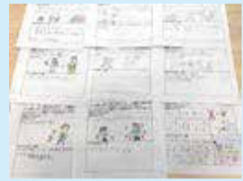
▲川南小4年生から寄せられたアイデア(令和2年度)

現在、プラスチックごみによる環境への影響や大量に排出されている「食品ロス」は大きな社会問題となっており、削減に向けてより一層の取り組みが必要となっています。そこで、日頃より皆さんが実践しているごみ減量のアイデアを募集します。プラスチック製品をなるべく使わない・捨てない生活の知恵や、食品ロスを削減するための上手な食品管理方法など、ごみ減量に資するアイデアをお待ちしています。応募いただいたアイデアは、区ホームページ等で紹介し、多くの区民の方のごみ減量の参考にしていただけます。また、アイデアを送っていただいた方の中から、抽選で30人にエコグッズを贈呈します 締 9/15(水)消印有効 申 応募用紙またははがきに①氏名②住所③アイデア④アイデアのねらいを記入し、〒135-8383区役所清掃リサイクル課に郵送、ファクスまたは窓口で※区ホームページからも申込できます