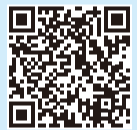
▲ごみ減量アイデア 区ホームページ