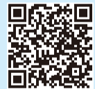
▲ごみダイエット家計簿 区ホームページ

【ごみ減量アイデア、ごみダイエット家計簿資料配布場所】 清掃リサイクル課(区役所隣防災センター6階4番)、 こうとう情報ステーション(区役所2階)、清掃事務所・えこっくる江東(潮見1-29-7)、消費者センター(扇橋3-22-2)、各出張所※区ホームページからも入手可 問 清掃リサイクル課☎3647-9181、FAX5617-5737