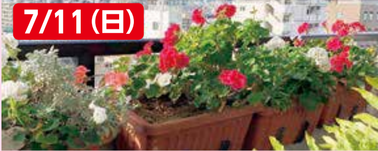
▲「みどりある生活」おススメです!

区内ではマンションのベランダでみどりを楽しむ方が増えてきました。すでに楽しんでる方もこれからの方も、みんなで交流しながら、ベランダならではの植物のお手入れ方法や楽しみ方を学びませんか。