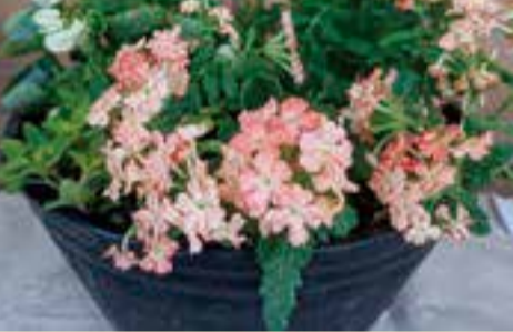
▲寄せ植えセットはご自宅まで配送します

マンションのベランダでお花やハーブなどの植物を育てる方法や、植物のある暮らしの楽しみ方をオンラインで学びます。おうち時間を豊かにするベランダガーデニングライフをはじめてみませんか。