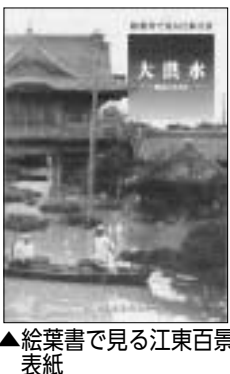
▲絵葉書で見る江東百景表紙

区内の文化財や史跡のガイドマップを改訂しました。区内の名所を描いた錦絵や写真、絵図などを豊富に掲載しています。江東区の文化財めぐりに欠かせない1冊です。