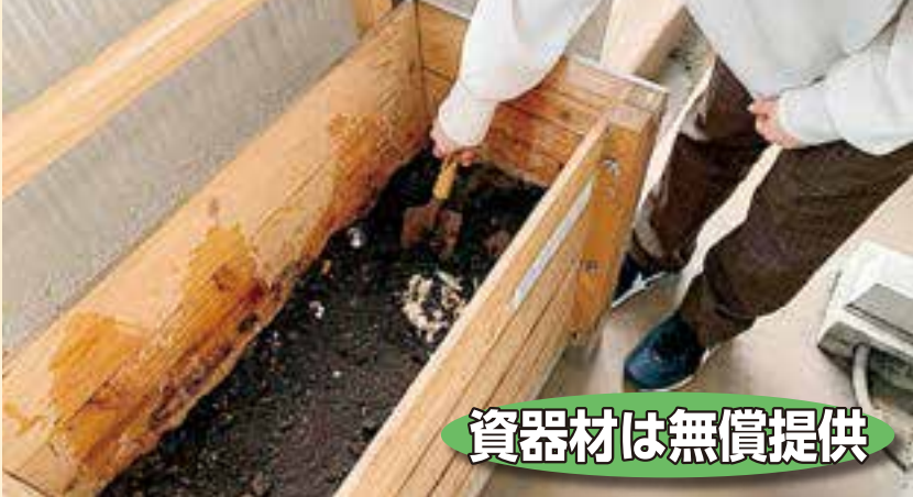
▲資器材を利用して生ごみ減量に取り組んでいる様子

区では、燃やすごみの約40%を占める生ごみを減らすために、各家庭で「生ごみ減量」に取り組んでいただける方やグループ活動を行う皆さんを募集しています。取り組みに必要な資器材は区が無償提供し、家庭のベランダや室内で手軽に取り組むことができます。この取り組みにより、ごみ出しの負担が減るほか、資器材によってはガーデニング用の良質な堆肥を得ることができます。☑ 区内在住で生ごみ減量活動に1年以上取り組める区民(グループ可) 150人(抽選) ※平成27~令和2年度に申し込まれた方は対象外 ☒ 無料 ☑ 4種類の資器材の中から、各家庭にあったものを1つ選ぶことができます。右表の説明会(いずれか1日)に参加し、取り組み方式を決めていただきます。取り組み開始後、8月開催予定の講習会に参加していただきます。☎ 6/8(火) 必着 ☑ 電話、窓口またはファクス・はがきに①氏名(ふりがな)②住所③連絡先④説明会の希望する日時を第2希望まで記入し、〒135-8383区役所清掃リサイクル課へ※区ホームページからも申し込みできます※取り組みを希望する方でどうしても説明会の日程が合わない場合はご相談ください ☎ 3647-9181、FAX5617-5737