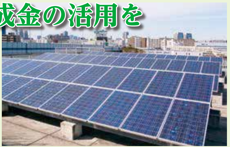
▲太陽光発電システム設置のイメージ