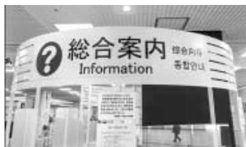
▲総合案内の案内表示

日本語だけでなく、外国語や図記号でも案内することで、日本語がわからない外国から来た方や、言葉が理解できない方でもわかる場合があります。