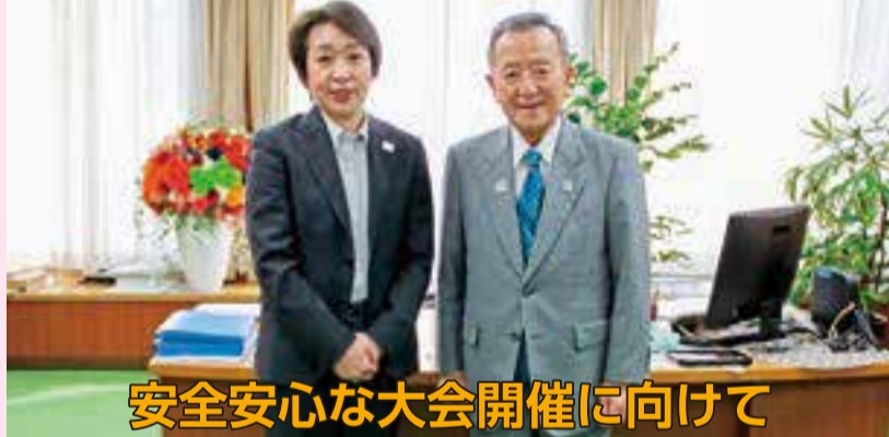
安全安心な大会開催に向けて