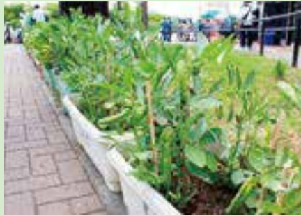
▲大島地区の小学校で栽培されたそらまめ

江戸の頃、旧中川地域から市中に広がり、江戸っ子が好んで食べた「中川そらまめ」にちなみ、地元大島をテーマに各種イベントを行います 時 場 下表のとおり 締 ④のみ4/23(金)必着 申 ①②③⑤⑥ 当日直接会場へ④ 往復はがきに「そらまめ料理」・住所・氏名・電話番号を記入し、〒136-0072大島7-38-4大島まちづくり協議会事務局浅野へ※作った料理の持ち帰りはできません 問 ▲大島地区の小学校で栽培されたそらまめ [①②③⑤⑥] 大島まちづくり協議会 (遠藤) ☎3682-2201 [④] 浅野 ☎090-3527-2170 HP http://www.nakagawa-soramame.com