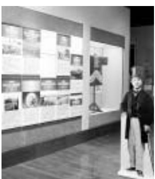
▶中川船番所資料館で開催中の特別展「渋沢栄一と江東」の様子

216万円 深川福住町(現在の永代2丁目)に12年間居を構えるなど、渋沢栄一と本区のつながりを区内外にPRするイベントを実施し、観光振興や産業振興へとつなげていきます。