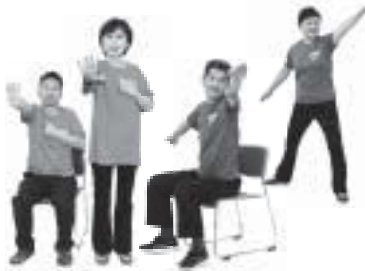
▲KOTO活き粋体操 (区独自の介護予防体操)

124万円 オンラインでのサークル活動の継続や、KOTO活き粋体操オンライン活動の導入を後押しするため、ICT機器の操作支援等を行います。