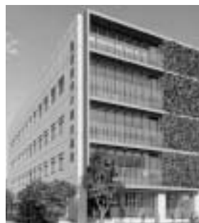
▲児童向け複合施設外観イメージ

20億5,765万円 児童会館の跡地を活用し、子ども家庭支援センターと子どもとしょかんを合築した児童向け複合施設の整備を進めます(令和4年5月開設予定)。