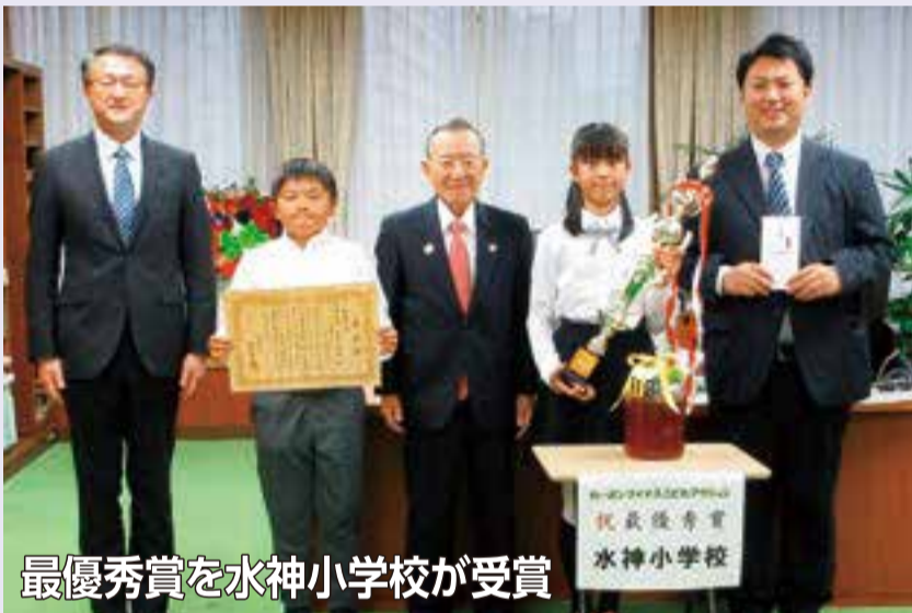
最優秀賞を水神小学校が受賞