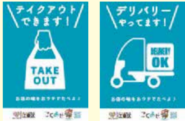
◀このポスターが目印

区民のテイクアウト・デリバリー利用を促進しながら、飲食事業者への支援につなげるため、テイクアウト・デリバリー商品の提供において消費者還元策を実施する事業者に対し、10万円を上限として補助金を助成しています。店舗にはポスターを配布します。