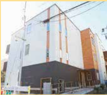
▲グループホームきらら南砂元八幡の外観