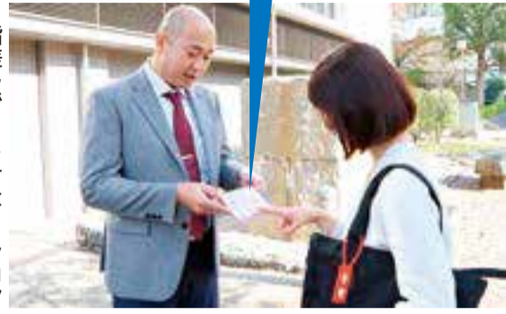
指差しでコミュニケーションがスムーズに

障害者支援課身体障害相談係 (防災センター2階14番)に設 置し、窓口での手続等で使用し ます。