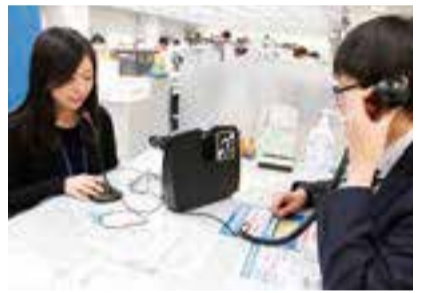
▲窓口用ヒアリンググループシステムを使用する様子

②会議用ヒアリンググループシ ステム 区の会議や説明会、講演会等 で使用します。