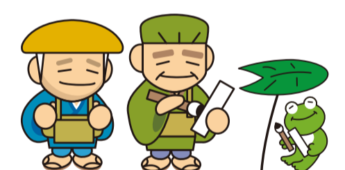
▲「奥の細道サミットin江東」キャラクター(左から)でしそら、ばしょうさん、かわずくん

時 11月27日(金)〜12月6日(日) 午前9時半〜午後5時 場 内 左表のとおり 費 スタンプラリー無料※展示一部有料 申 当日直接会場へ 係 芭蕉記念館