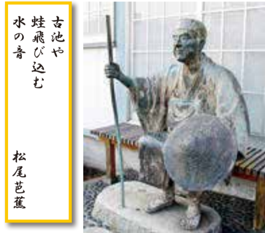
古池や 蛙飛び込む 水の音 松尾芭蕉

松尾芭蕉(1644~1694) 深川の芭蕉庵で多くの俳句を作成。 「おくのほそ道」の旅も深川から出発しました。区内には今なお芭蕉ゆかりの史跡が多く残されています。