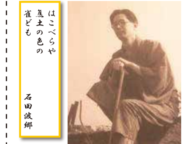
はこべらや 焦土の色の 雀ども 石田波郷

小林一茶(1763~1828) 江戸後期の俳人。大島に住んでいました。大島愛宕神社には「雀の子そこのけそこのけ御馬が通る」の句碑が建てられています。