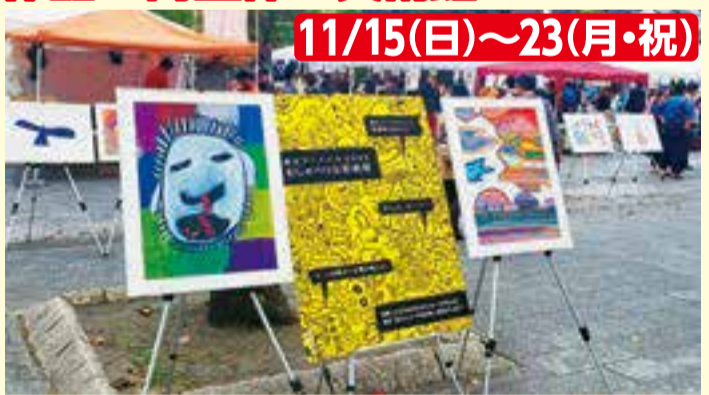
▲富岡八幡宮や深川不動堂の参道にアート作品が飾られます

深川エリア(門前仲町、清澄、白河、森下)の街全体が美術館になる障害のあるアーティスト作品による「アートパラ深川おしゃべりな芸術祭」が初開催。アートの力が人々を引き寄せ、おしゃべりを楽しみ、お互いを認め合い、支え合う「共に生きる」社会を目指します。