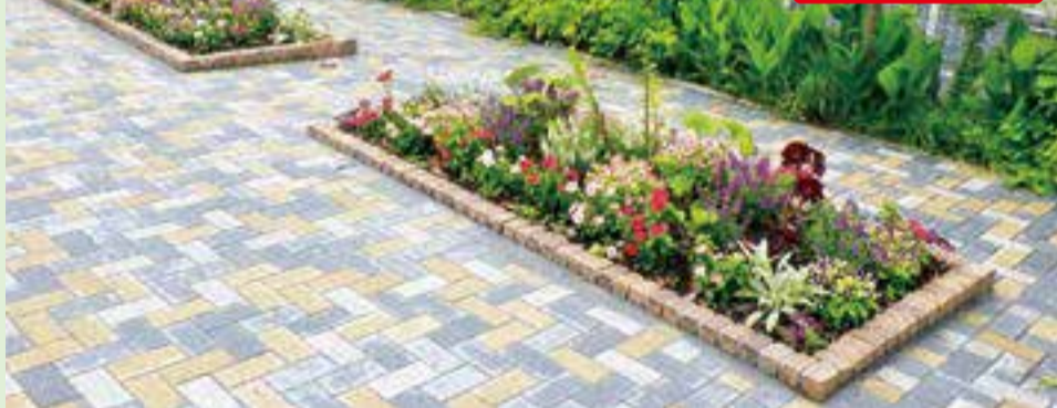
▲北砂公園のコミュニティガーデン

区では、公共緑地(区立公園など)の花壇を利用し、グループで花や緑を育て、地域の憩いと交流の場となるコミュニティガーデン(以下、CG)活動を行っています。地域の方が丹精込めた花壇を見ながらお散歩してみませんか。今回、花や緑が好きな方、CG活動に興味のある方を対象に北砂での見学会を開催します。みどり館を起点に砂町銀座商店街で有名な北砂のまちなかをグリーンアドバイザーのガイド付きでお散歩します。実際にCG活動している方々の体験談も伺います。お気軽にご参加ください。