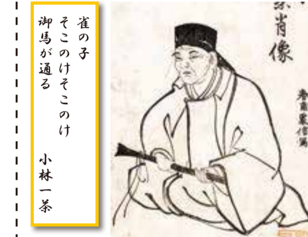
雀の子 そこのけそこのけ 御馬が通る 小林一茶

松尾芭蕉(1644~1694) 深川の芭蕉庵で多くの俳句を作成。 「おくのほそ道」の旅も深川から出発しました。区内には今なお芭蕉ゆかりの史跡が多く残されています。