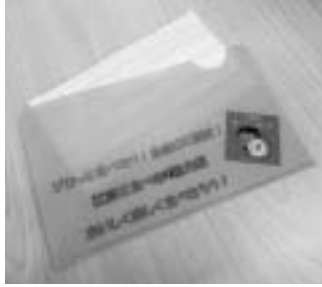
▲協力店に配布するマスクケース(マスクはついていません)