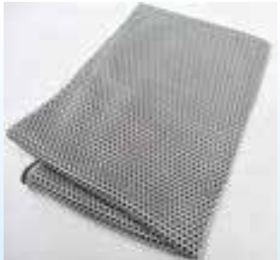
▲ご自宅へ届く封筒、タオルはこちら