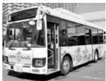
▲コミュニティバス「しおかぜ」

潮見駅を起終点に木場ルート・辰巳ルートを走行するコミュニティバス「しおかぜ」で、4/1(水)から交通系ICカード(PASMO・Suicaなど)の利用ができます※都バス定期券(フリーカード)、都バス一日乗車券、都営まるごときっぷ、東京都シルバーパスおよび無料乗車券は利用できません※バス車内でのチャージは千円札のみ※運行の詳細は区ホームページをご覧ください[運賃]小学生以上100円 [問]都営交通お客様センター☎3816-5700、交通対策課交通係☎3647-4784、FAX3647-9287