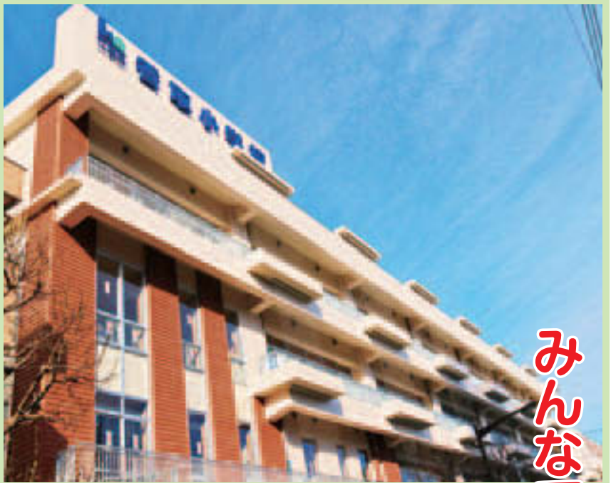
▲普通教室を南側に配置した明るい新校舎