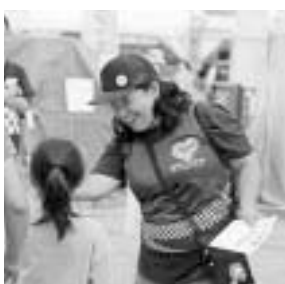
▲KOTOスポーツキャラバンでの活動

6,349万円 東京2020大会に向け、令和元年度から募集・運用を開始した区独自ボランティア「江東サポーターズ」の活動を拡充し、区を訪れる観客へのおもてなしを区内全域で行うことで、区民と一体となって大会を盛り上げます。