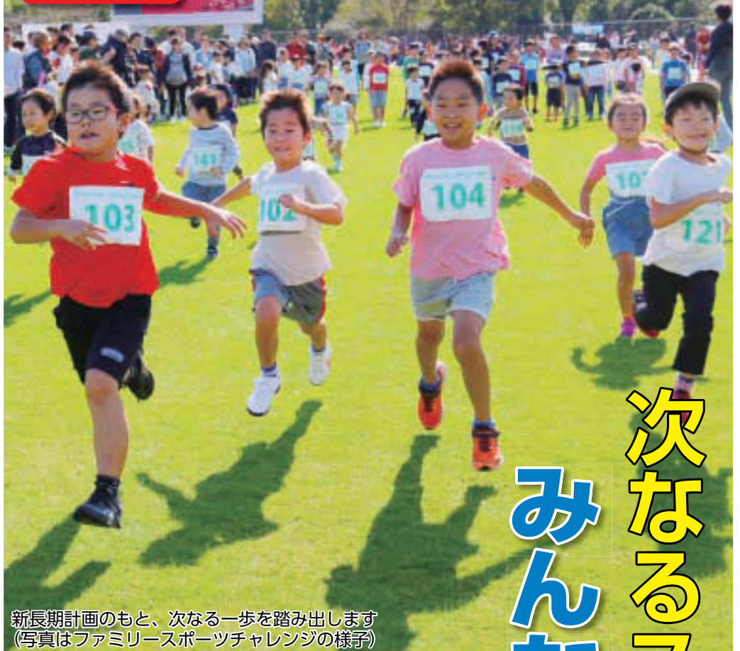
新長期計画のもと、次なる一歩を踏み出します (写真はファミリースポーツチャレンジの様子)