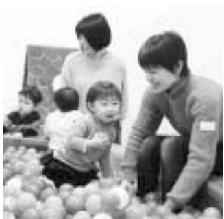
▲子育てをする家庭をサポート

696万円 南砂子ども家庭支援センターの職員体制を強化し、こども家庭支援課と合わせて「江東区子ども家庭総合支援拠点」と位置付け、子育て支援と虐待予防・対応に必要な体制を強化します。