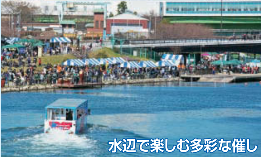
水辺で楽しむ多彩な催し