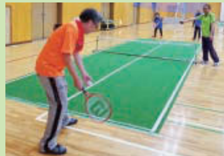
▲バウンドテニスなどを体験

障害者スポーツを含むニュースポーツの体験会を行います 時 3/22(日)10:00~15:00(受付9:45~) 場 スポーツ会館大体育室(北砂1-2-9) 人 どなたでも 費 無料【体験種目】気功、健康体操、健康吹矢、バウンドテニス、カローリング、フロアボール、スラックライン、卓球、ボッチャ等。参加賞・スタンプラリーでの景品あり【持ち物】室内シューズ【主催】江東区・NPO法人ななすぽ 申 当日直接会場へ 関 NPO法人ななすぽ ☎080-5071-7756 HP http://7supo.com