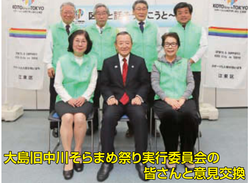
大島旧中川そらまめ祭り実行委員会の 皆さんと意見交換