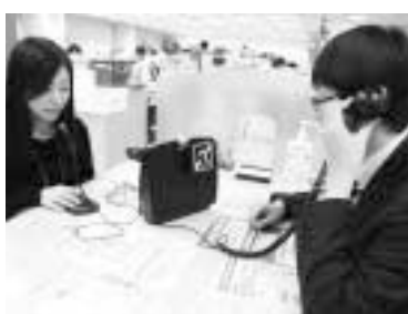
▲難聴者の円滑な意思疎通を図るヒアリンググループ使用イメージ

9,790万円 みどり豊かなまちなみづくりに向けて、公園の接道部を積極的に緑化するほか、駅前広場などにシンボルツリーや花壇を設置します。