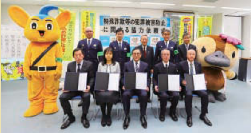
▲協力依頼書を手に皆さんで

区では、安全安心のため、地域の皆さんや警察等の関係機関と連携し、区報での注意喚起、街頭防犯カメラの設置などさまざまな被害防止対策を推進しています。近年、区内の犯罪被害は減少傾向にあります。特殊詐欺は依然として多くの被害が発生し、さらなる取り組みの強化が必要となっています。そこで、2/10、区は、東京湾岸・深川・城東の三警察署とともに4者で、以前から被害防止対策にご協力いただいている江東区医師会、歯科医師会および薬剤師会、東京ペイネットワーク(株)、レインボータウンエフエム放送(株)に対し、さらなる連携強化として、特殊詐欺等の犯罪被害防止に関する協力依頼書を交付しました。今後、病院や薬局での被害防止の呼びかけや注意喚起チラシの配布、ケーブルテレビやラジオを通じた被害防止のための情報発信がさらに強化され、より一層、区内の安全安心が期待されます 関 危機管理課防犯担当 ☎3647-4399、FAX3647-9651