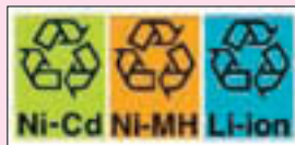
▲充電式電池のマーク