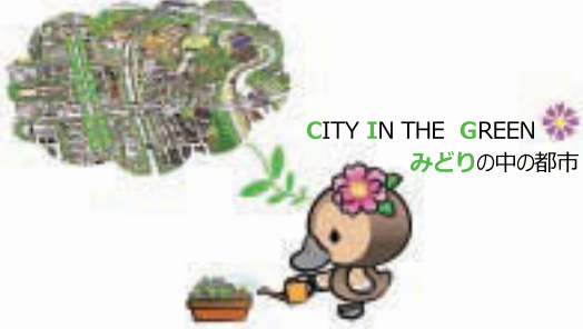
▲江東区観光キャラクター コトミちゃん