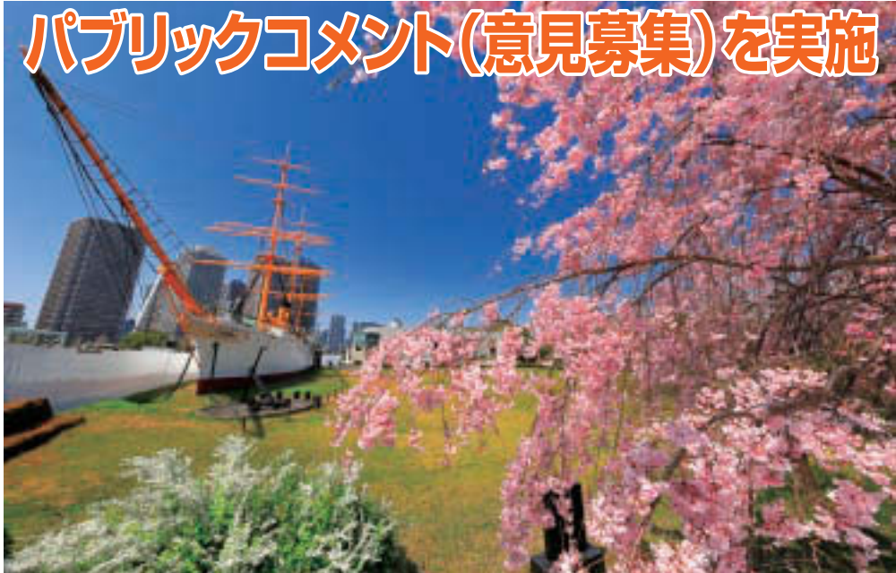
▲CIG(CITY IN THE GREEN)オンラインフォトコンテスト平成30年度CIG大賞作品

区では、平成19年7月に「江東区みどりと自然の基本計画」を策定しました。その後の社会情勢等の変化に対応するため、改定を行います。