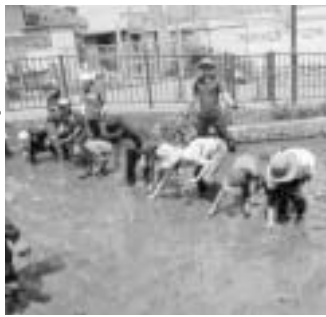
▲田んぼの学校の様子

感謝祭は「収穫祭」に似ていて、その名の通り食料、住まい、家族や友人にThanks(感謝)をgiving(ささげる)ための日です。気候が寒いカナダでは10月の第2月曜日に、アメリカでは11月の第4木曜日に祝われます。そしてその次の金曜日がクリスマスに向けての準備が一気に始まるアメリカ文化発祥の「ブラックフライデー」です。ちなみに両国とも勤労感謝の日は9月にありますが、文化の日はありません。文化が違うと祝日も違うので、外国の人に自国の祝日について聞いてみるのも楽しいですよ。☎ オリンピック・パラリンピック推進課連携・調整係 ☎ 3647-5513、FAX3647-8459