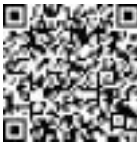
▲ウェブ予約用二次元コード

胃がん(バリウム)・肺がん検診は申込制で実施しています。必ず下表で会場と日程を確認したうえで、予約してください。今年度の胃がん(バリウム)・肺がん検診申込案内は今回で終了です。まだ受診していない方は早めに受診しましょう 40歳以上の区民の方※50歳の方は、胃がん(内視鏡)検診か胃がん(バリウム)検診のどちらか1つを受診できます 胃がん(バリウム):500円、肺がん:800円 上記に記載※受付の開始直後は電話が大変混み合います。つながらない場合は時間を置いておかけ直し願います※専用はがきでの申込は12/31(火)(必着)で終了します※電話・ウェブでの申込は令和2年1/31(金)で終了します。検診日当日は受診券シールが必要で 保健所健康推進課健康づくり係 ☎3647-9487、FAX3615-7171