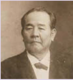
▲渋沢栄一

日本経済や銀行の礎を築き、日本資本主義の父と呼ばれる渋沢栄一。江東区との関係は深く、深川区会議長などを経て、明治30年には澁澤倉庫部(現:澁澤倉庫株式会社)を設立し、深川の発展に尽力しました。渋沢栄一とゆかりの実業家たちの足跡をたどります 時 12/11(水)~13(金) ①9:00出発②12:00出発※雨天決行 集 大江戸線清澄白河駅改札前(出発時間の10分前までに集合) 入 3時間程度歩くことができる小学生以上の方、各回20人定員(申込順、1組3人まで、小学生は保護者同伴) 費 500円(保険代ほか)※小学生無料[ガイドコース]大江戸線清澄白河駅(出発)-三野村ビル-清澄公園-セメント発祥の地-澁澤倉庫(澁澤シティプレイス)-福住稲荷-深川東京モダン館(解散) 申 11/26(火)9:00から電話で江東区文化観光ガイド事務局(江東区観光協会内) ☎6458-7410、FAX6458-7420