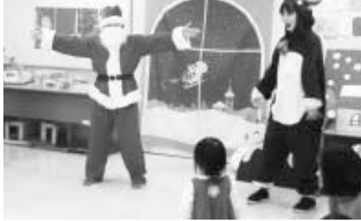
▲クリスマス会などさまざまな催し

児童館は、乳幼児・小学生・中学生・高校生世代と保護者の皆さんを応援する施設です。赤ちゃんの頃から児童館で遊び、その後小学生、中学生、高校生世代になっても気軽に遊びに行けます。