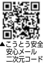
こうとう安全安心メール登録用二次元コード