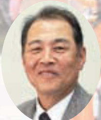
村田真一さん 元プロ野球選手・ 野球解説者