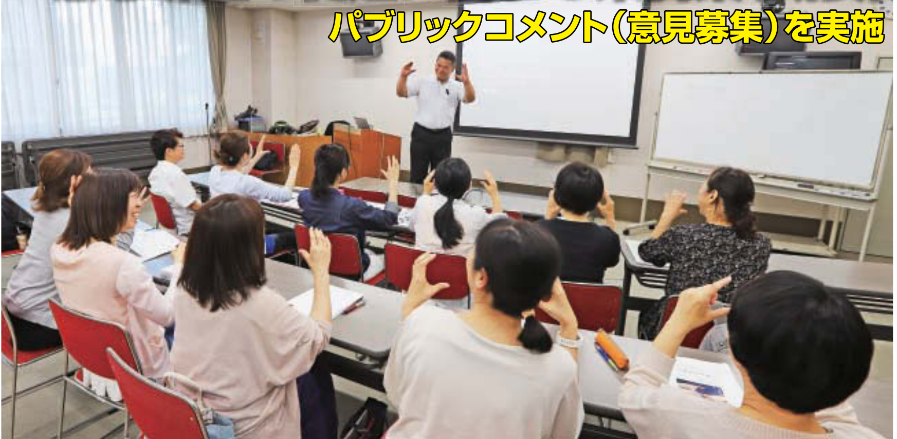
▲ろう講師による手話指導と手話を学ぶ受講生たち(写真は江東区手話講習会「養成コース」)