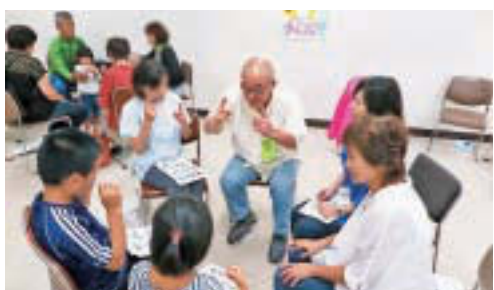
▲ろう者が子どもたちに手話を教えている様子(写真は江東ボランティアまつり)

啓発 ② 環境整備 意思疎通手段の利用に資する環境整備 ③ 習得機会 意思疎通手段を習得する機会の提供