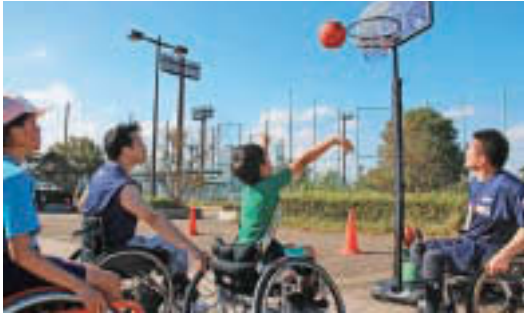
▲障害者スポーツの体験(写真はこうとうこどもスポーツデー)