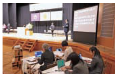
▲パソコンの動作確認をする要約筆記者たち(写真は江東区障害者福祉大会)