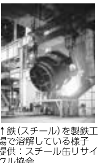
↑鉄(スチール)を製鉄工場で溶解している様子

資源の日に回収している缶は、飲料用のほか、お菓子や海苔などの缶も対象です。軽くすすいで汚れを落とすかから出してください。区の回収では、とを分ける必要はありません。油分がついた缶やスプレー缶は「燃やさないごみの日」に出してください。今回は缶のゆくえをお伝えします。 ① 中間処理施設 回収された缶は、中間処理施設に運ばれ、異物を取り除きます。その後、磁力を利用してとに選別し、輸送効率を高めるための圧縮処理をします。 ② 再生工場 とそれぞれ別の再生工場に運ばれ、高温で溶かして再び鉄やアルミを製造します。 ③ 再び製品化へ 再生工場で製造された鉄やアルミは、製缶メーカーや建材メーカーなどで、さまざまな製品になります。 ↑分別した缶は、再び缶として再生されたり、自動車の部品や家電製品、建物の鉄筋などに利用されます。