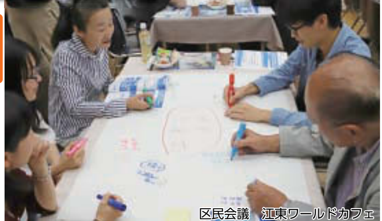
区民会議 江東ワールドカフェ

区では、令和2年度からの10年間を計画期間とする新たな長期計画の策定を進めています。今後もまちの発展や人口の増加が見込まれる中、このたび「江東区長期計画(分野別計画)」の素案がまとまりましたので、その内容をお知らせするとともに、計画に対するご意見を募集します。