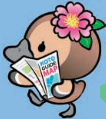
江東区観光キャラクター コトミちゃん

区内には多くの体験・学習施設があります。今回はその中から自由研究等におすすめの6か所を紹介します。詳細は各施設にお問い合わせいただくか、ホームページ(各二次元コードから入れます)をご覧ください。このほかにも多くの体験・学習施設があります。この夏に区内の施設へお出かけしてみませんか。