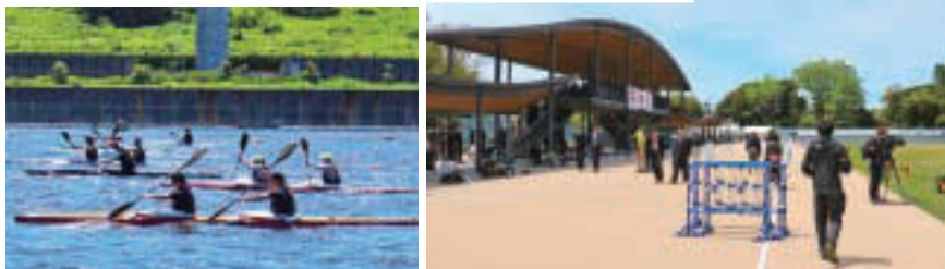
▲デモンストレーション