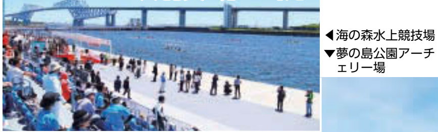
▲海の森水上競技場 ▼夢の島公園アーチェリー場