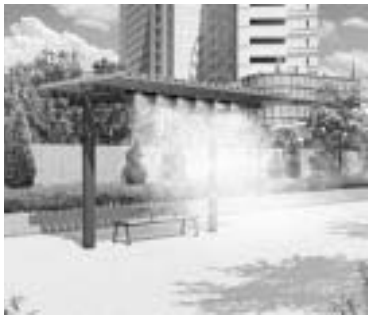
▲ミスト設備の設置イメージ

観光客を含めた公園利用者を熱中症・熱射病等から守るため、豊洲ふ頭内公園にミスト設備の付いたパーゴラや東屋を設置し、クールエリアを創出することで、暑熱環境の緩和を図ります。