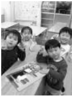
▲笑顔で遊ぶ園児たち

保育需要に迅速に対応するため、民設民営による保育施設の整備などにより、約1,300人の認可保育所定員の増を図ります。