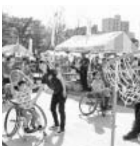
▲区内で行われる競技を体験

大会の気運醸成のため、開催回数を増やすとともに、トップアスリートの技とスピードを体験することができる観戦型コン