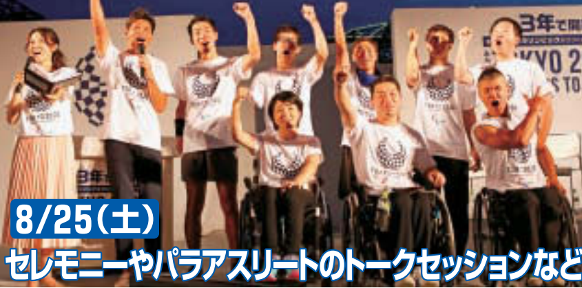
▲昨年行われた3年前イベントの様子(東京都提供)

8/25(土) セレモニーやパラアスリートのトークセッションなど 東京2020パラリンピック開催の2年前の節目となる8月25日(土)に、東京都および東京2020組織委員会によるカウントダウンイベントが開催されます。8月最後の土曜、皆さんぜひご参加ください。 時 8月25日(土) 午前11時~午後7時 場 MEGA WEB(青海1-3-12) どなたでも カウントダウンセレモニー、パラアスリート等によるトークセッション、パラリンピック競技の体験コーナー等 申 当日直接会場へ 問 東京都オリンピック・パラリンピック準備局パラリンピック調整課 ☎ (5388) 2496 FAX (5388) 1229