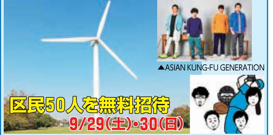
▲ASIAN KUNG-FU GENERATION